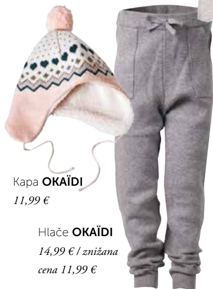
Kapa OKAĪDI 11,99 €