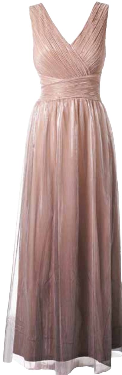
Obleka ORSAY 55,99 €