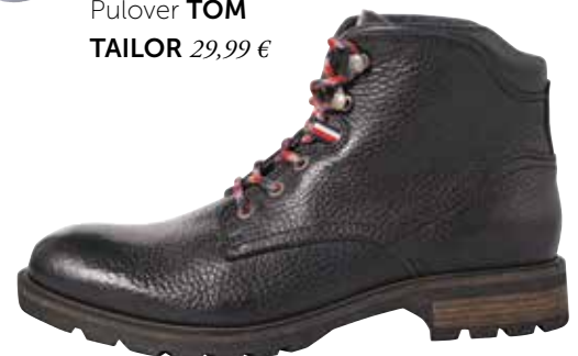
Obutev Tommy Hilfiger OFFICE SHOES 159,95 € / znižana cena 63,95 €