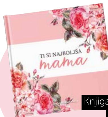
Knjiga Ti si najboljša mama (Založba Karantanija) MLADINSKA KNJIGA 9,90 €