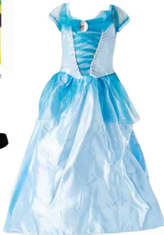
Otroški kostum ledena princeska, velikost od 110 do 140 cm INTERSPAR 24,90 €