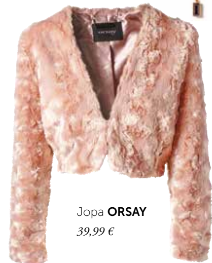
Jopa ORSAY 39,99 €