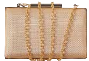
Torbica PARFOIS 22,99 €