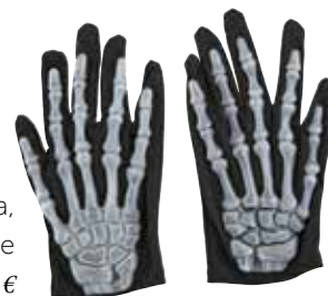
Rokavice za okostnjaka, otroške ali za odrasle INTERSPAR 5,99 €