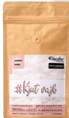
Mleta kava Escobar #Kjet vajb BAGS&MORE 3,95 €