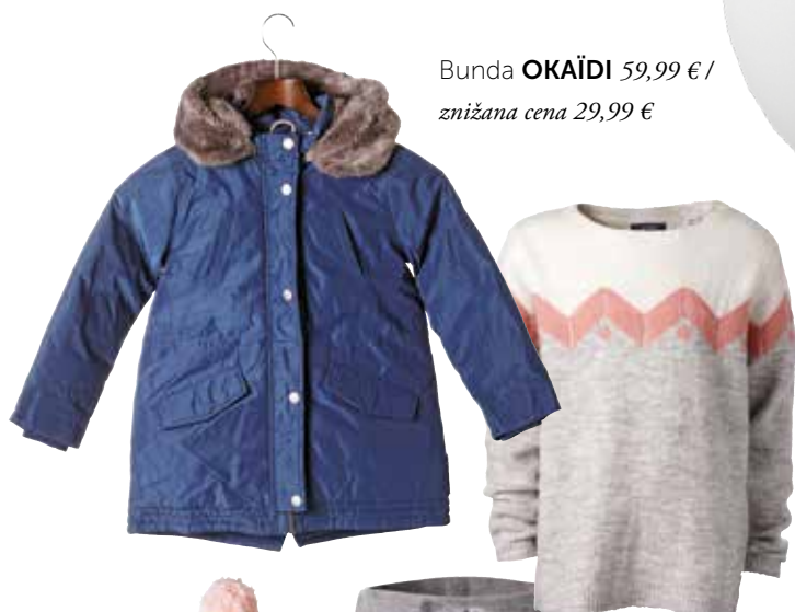
Bunda OKAĪDI 59,99 € / znižana cena 29,99 €

Z ima je še posebej razigrana v otroških očeh. Kako pa naj ne bo, če se v soju novozapadlega snega in lučk vse spremeni v čarobno pokrajino. Naj se navihnost odraža tudi pri izbiri oblačil. V zimski belini bodo najbolj izstopale močne barve, ki jih uskladite z otrokovo osebnostjo. Naši mali sončki bodo preprosto zasijali v toplih rumenih odtenkih sonca. Ne pozabite na tople dodatke – nepogrešljivi so za brezskrbno igranje zunaj.