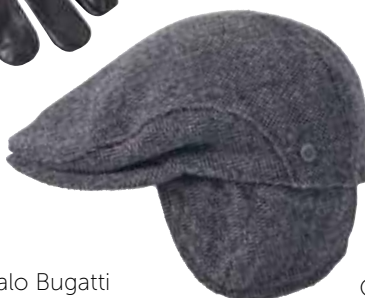
Pokrivalo Bugatti PEEK & CLOPPENBURG 49,99 €