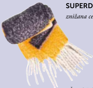
Šal ORSAY 17,99 €