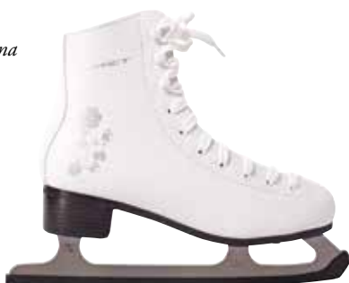
Drsalke Peggy HERVIS 59,99 € / znižana cena 39,99 €