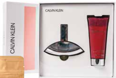
Darilni set Calvin Klein Euphoria dm drogerie markt 44,99 €