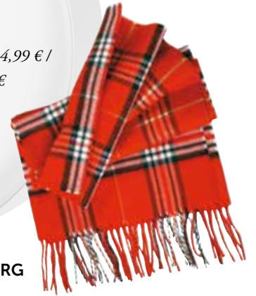
Šal Cashmink PEEK & CLOPPENBURG 19,99 €