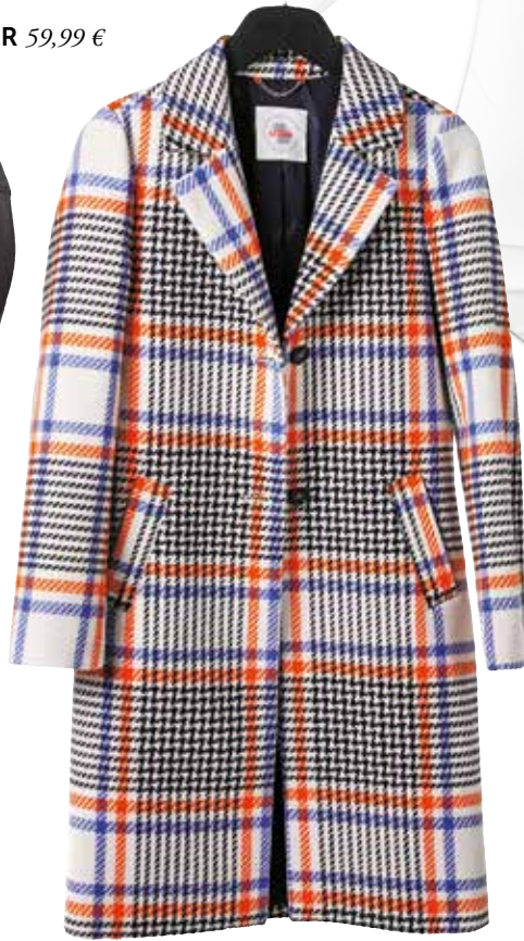
Plaćč S.OLIVER 129,99 €