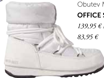
Obutev Moonboot OFFICE SHOES 139,95 € / znižana cena 83,95 €