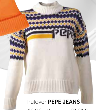
Pulover PEPE JEANS 85 € / znižana cena 59,50 €