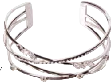
Zapestnica Brosway STEN TIME 84 €