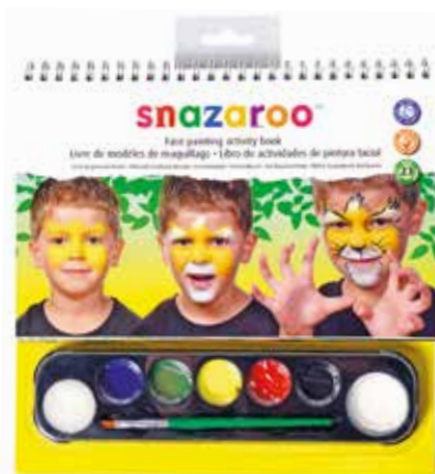
Barve za obraz in knjiga za poslikavo Snazaroo ART 15,99 €