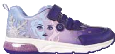
Obutev (št. 30) GEOX 71 €