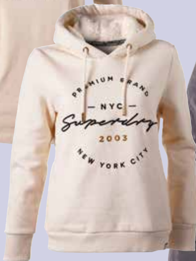
Pulover s kapuco SUPERDRY 89,99 € / znižana cena 62,99 €