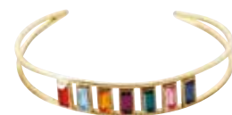
Zapestnica Brosway STEN TIME EXCLUSIVE 66 €