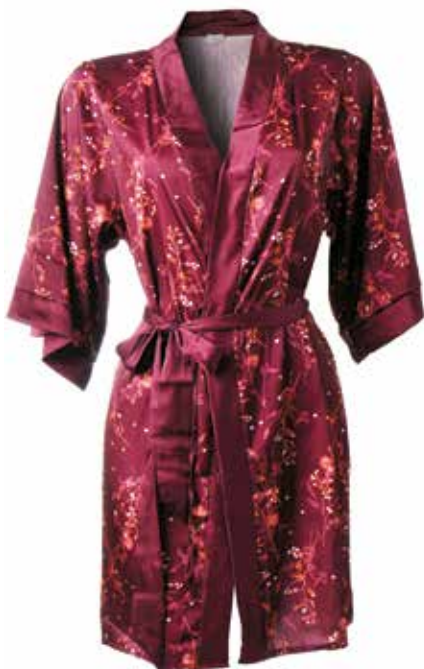
Halja Bonatti SOCKS 35,99 €