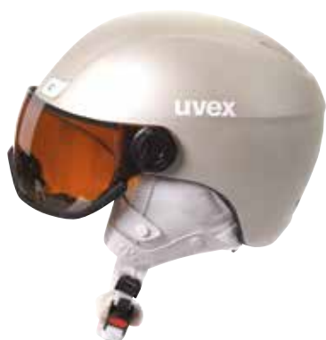
Smučarska čelada z vizirjem Uvex HERVIS 179,99 € / znižana cena 119,99 €

G ore imajo v zimskih mesecih prav poseben čar. Zasneženi vrhovi ustvarijo popolnoma novo pokrajino, ki vas bo pustila brez besed. Ne pozabite na ustrezno toplo in nepremočljivo opremo, dereze ter cepin. Na pot pa povabite tudi izkušenega hribolazca, še posebej, če se na zimski gorski podvig odpravljate prvič. Ne marate adrenalina? Ostanite ob vznožju in se zabavajte ob številnih sproščujočih aktivnostih. Tudi postavljanje snežaka ali kepanje je lahko odlična rekreacija.