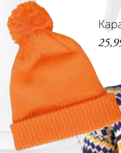
Kapa TOM TAILOR DENIM 25,99 € / znižana cena 13 €