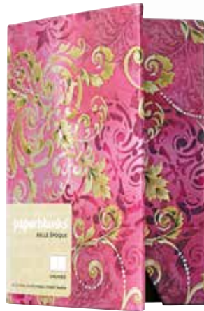
Blokec Paperblanks Papirnica HARTIS 15,99 €

M ir, spanje, dan brez obveznosti in srečne otroke. To so odgovori, ki smo jih prejeli, ko smo mame vprašali, kakšno darilo si želijo za materinski dan. Se želite zares izkazati? Organizirajte tak dan, ki bo mami segel naravnost v srce – pripravite bogat zajtrk, pospravite za sabo in jo povabite na druženje. Tako malo je treba, da mami narišete nasmeš na obraz. Za piko na i pa ji podarite še majhno pozornost.