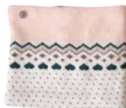
Šal OKAĪDI 11,99 €