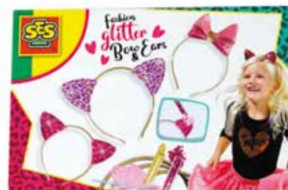
Set za izdelavo obročev za lase Ses MÜLLER 9,49 €