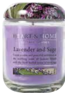
Dišeča sveča v kozarcu Heart&Home INTERSPAR 19,90 €