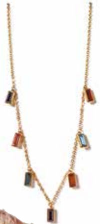
Veržica Brosway STEN TIME EXCLUSIVE 66 €