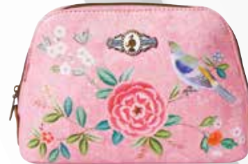
Toaletna torbica Pip Studio BAGS&MORE 29,99 €