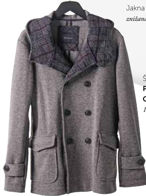
Jakna GALILEO 234,99 € / znižana cena 140,99 €