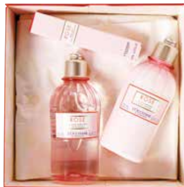
Lepotni paket Vrtnice (mleko za telo, gel za prhanje in toaletna vodica roll-on) L'OCCITANE 60,50 € / brez darilne škatle 58 €