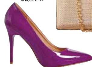
Obutev PRINCESS 19,90 €