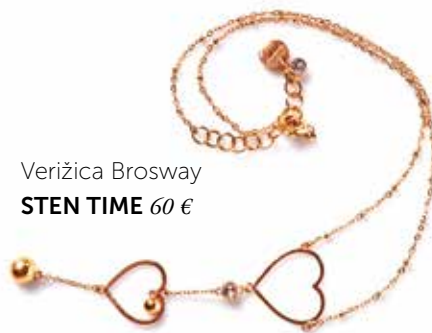
Veržica Brosway STEN TIME 60 €