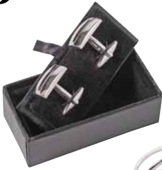
Manšetni gumbi 7CAMICIE 29,90 €