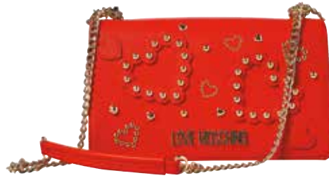
Tobica Love Moschino HUMANIC 190 €