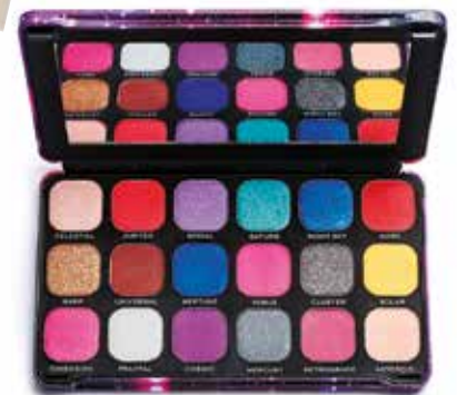
Paleta senčil Makeup Revolution dm drogerie markt 14,99 €