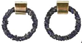
Uhani PARFOIS 6,99 €