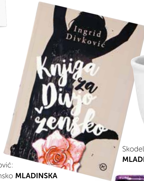
Knjiga Ingrid Divković: Knjiga za divjo žensko MLADINSKA KNJIGA 19,99 €

Lepo je biti ženska, še lepše pa je odkriti moč svoje ženskosti. Drage dame, ob dnevu žena si postavite cilj – vsak dan si povejte, na kaj ste pri sebi ponosne ter postanite še bolj močne in samozavestne kot dan prej. Pravijo, da ženske vodijo svet, mi pa verjamemo, da ga tudi vrtijo v pravo smer. Naj bo nebo meja. Uresničite vsak svoj cilj in si privoščite zasijati v vsej svoji lepoti.