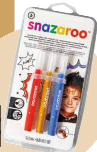
Čopiči za poslikavo obraza Snazaroo ART 9,69 €