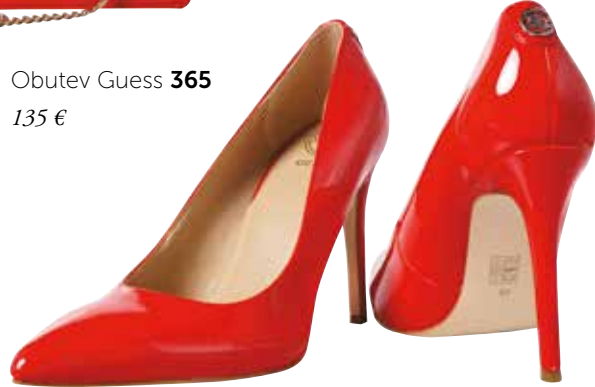
Obutev Guess 365 135 €