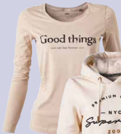
Majica Marx SPORTINA 19,99 €