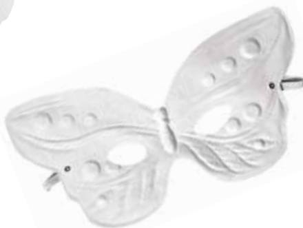
Bela maska metuljček za oči Hobby Fun ART 3,38 €

P rihaja čas razigranih in nagajivih maskar. Že veste, kaj boste letos za pusta? Uživate v igri vlog in se z nekaj domišljije preobrazite v najbolj čarobno, navihano ali prikupno strašljivo masko. Izjemne kostume poiščite v naših trgovinah, najbolj izvorni pa se lotite izdelave kar v domači ustvarjalnici. Ne pozabite na zabavne dodatke in pisane maske.