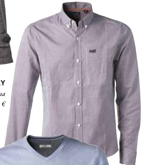
Srajca SUPERDRY 69,99 € / znižana cena 35,99 €