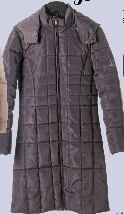
Bunda JONES 199,95 €