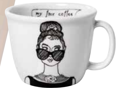
Skodelica za kavo Polona Polona MLADINSKA KNJIGA 22,90 €