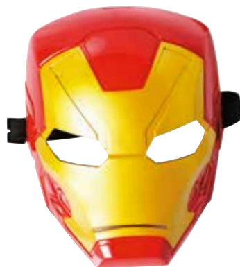
Herojska maska Power Rangers MÜLLER 12,99 €