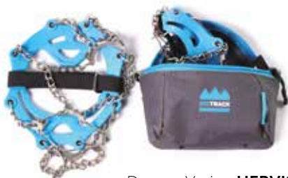
Dereze Veriga HERVIS 34,99 €