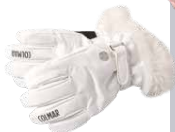
Smučarske rokavice Colmar HERVIS 104,99 €