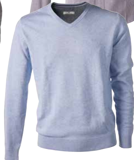
Pulover TOM TAILOR 29,99 €