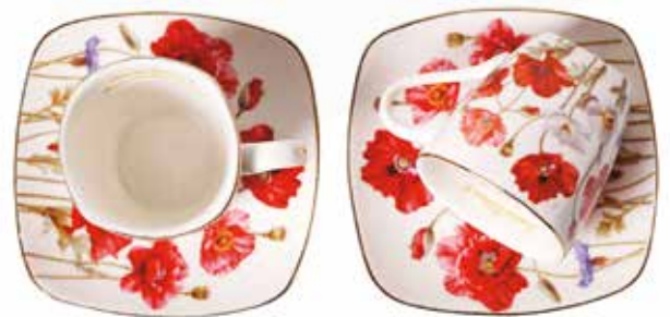
Skodelici za kavo AMADEUS 19,20 €